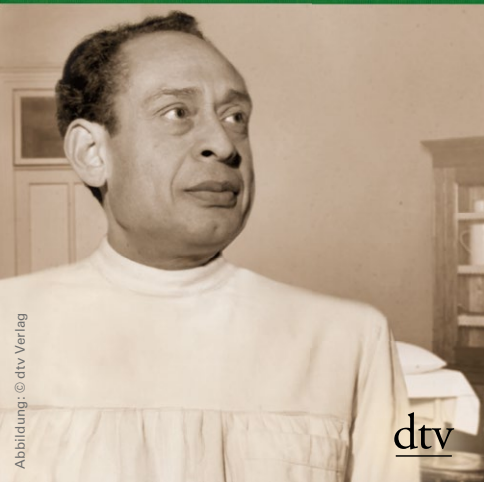
Abbildung: © dtv Verlag

Wie ein arabischer Arzt in Berlin Juden vor der Gestapo rettete